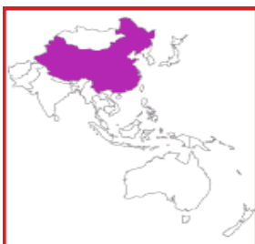
Illustration n°1 :